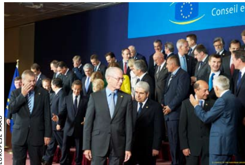
De Europese Ministerraad (hier bestaande uit de regeringsleiders) is het wetgevend orgaan van de EU