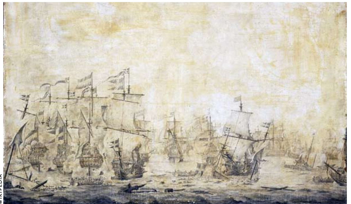
Willem van de Velde (1611-1693): Slag op het Sont, 8 nov 1658; v.l.n.r. de Carolus, de Eendraght, de Mercurius, de Rotterdam, de Pelikan, de Morgen-stjarna, de Halve Maen, de Krona en de Brederode (detail)

Dit voorjaar is het eerste deel van de database Sonttolregisters-online online beschikbaar gekomen, met de gegevens over meer dan 125 duizend doorvaarten uit de laatste dertien jaar van de achttiende eeuw. De gegevens zijn te raadplegen op www.soundtoll.nl .